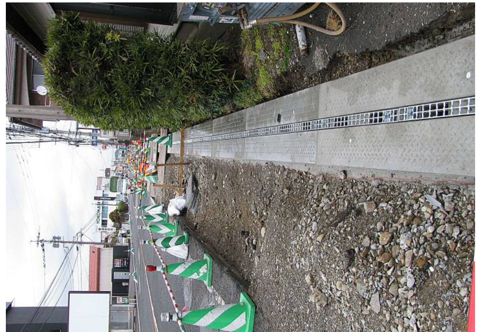
リニューアル側溝蓋（かんたん側溝FG使用） 宮崎市芳士