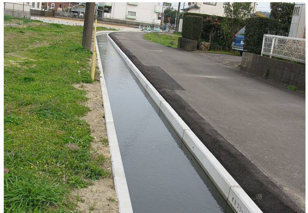
高鍋町用水路 かんたん側溝900×500 (FS) (開水路部は大型フリーム)