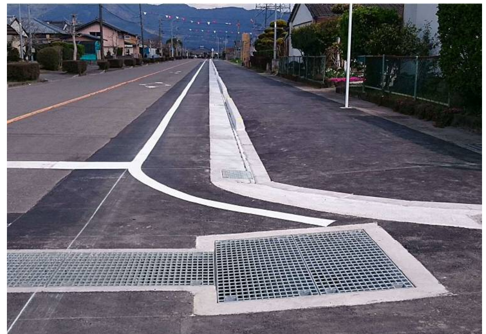
えびの市 原田排水路 かんたん側溝1000×900-1500 (可変型)