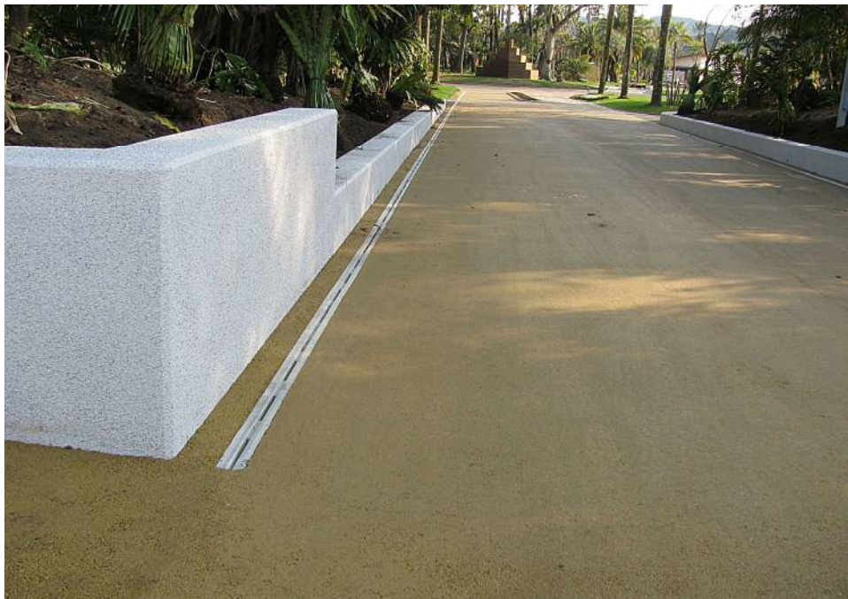
縁石を乗せず歩車反転して使用した状況