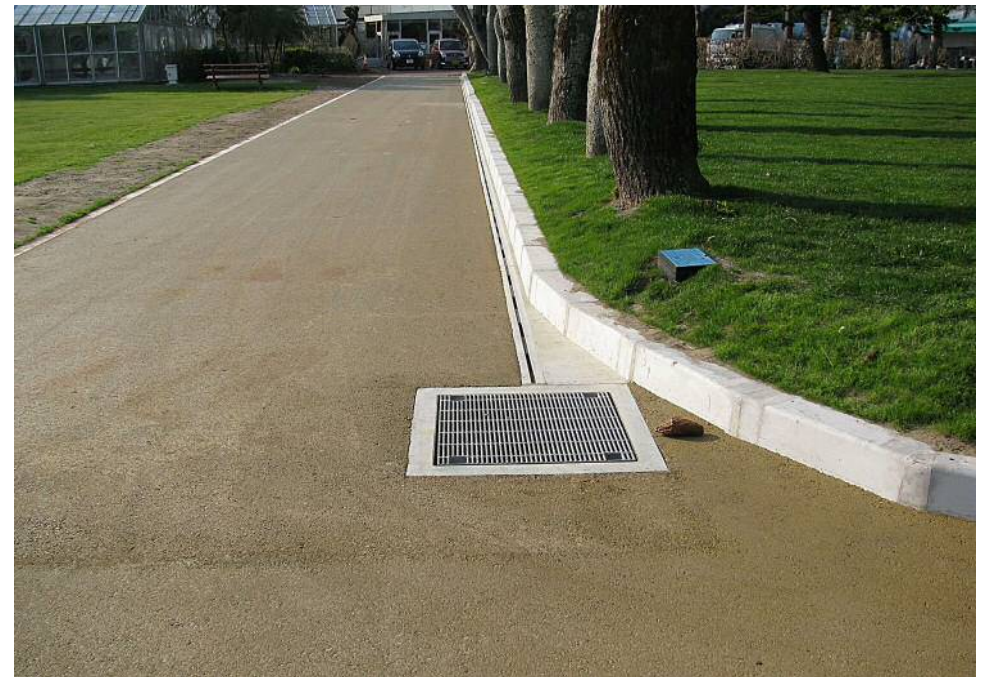
縁石に乗せた状況