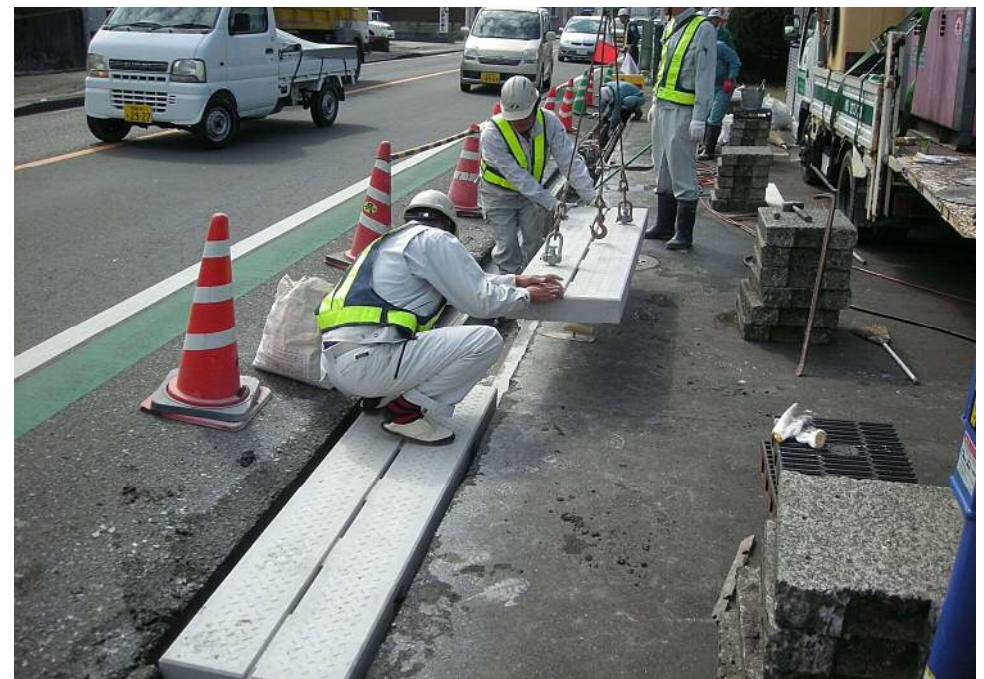
本郷南方 側溝蓋リリニューアル工事 (W2Rカッターによる既設側溝の切断)