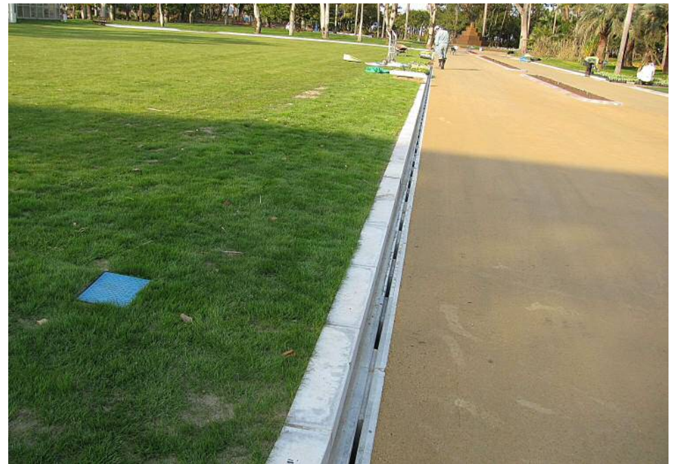
縁石を乗せて使用した状況