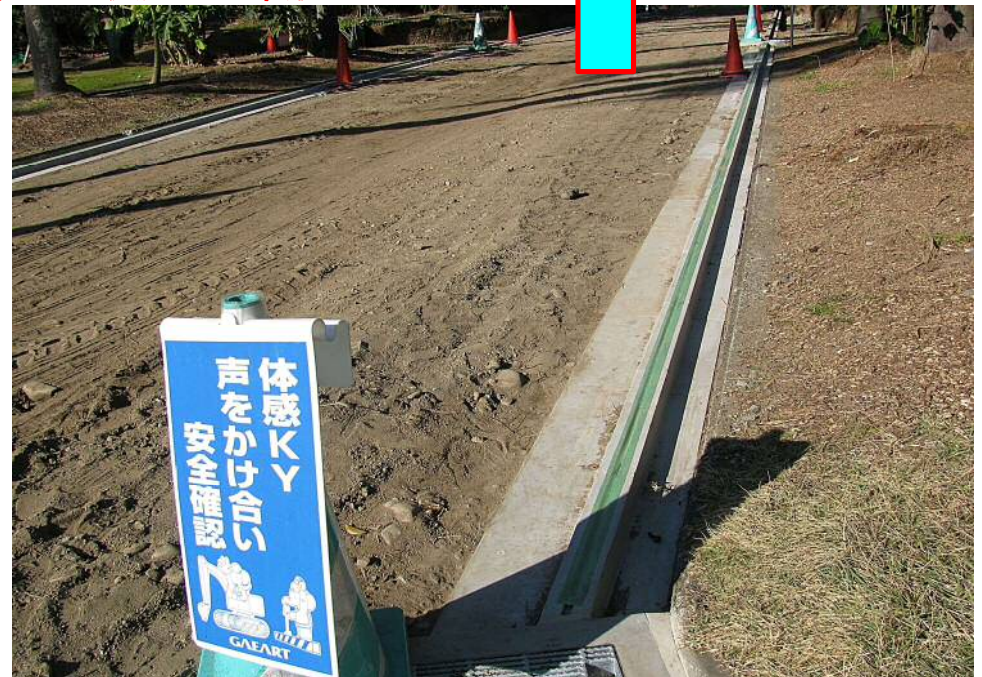
宮崎市青島亜熱帯植物園