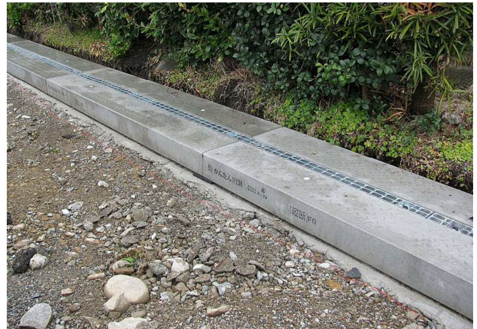
宮崎市芳士 側溝蓋改修工事 かんたん側溝蓋FG300・400