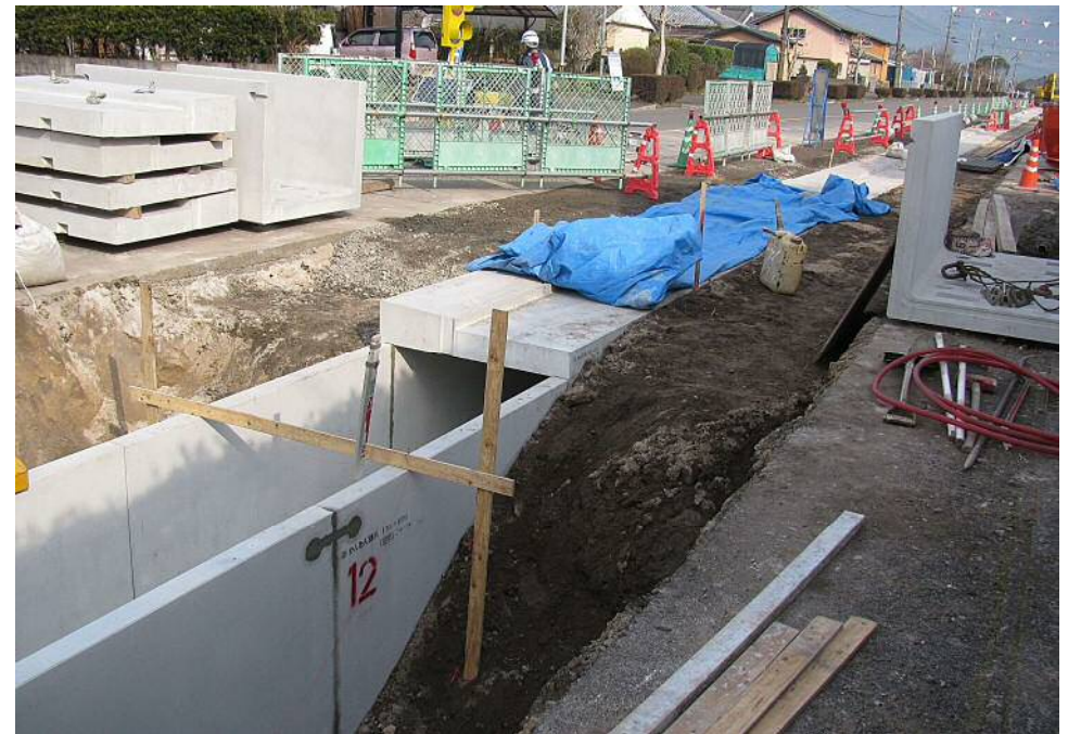
ガッター形状の特殊蓋 (6%W500 ; スリット付) を使用