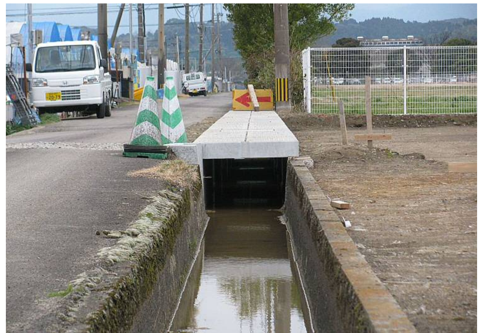
西都市用水路改修 かんたん側溝800×500 (FS) (開水路部は既存現場打)