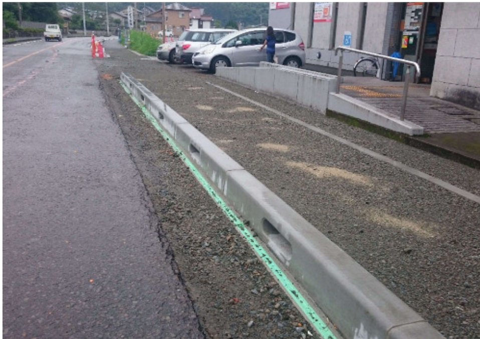
宮崎市高岡町 高鍋高岡線