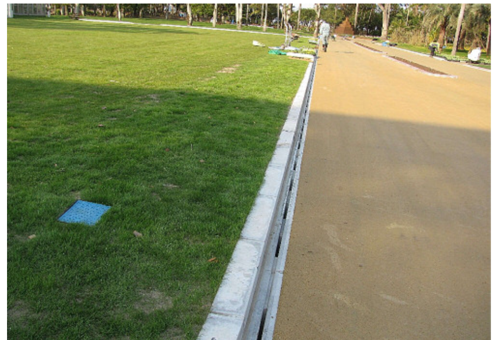
縁石を乗せて使用した状況