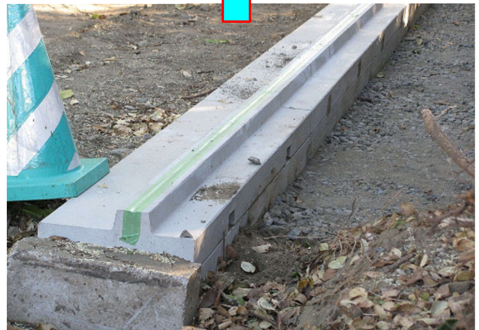
縁石を乗せずに歩車反転して使用した状況