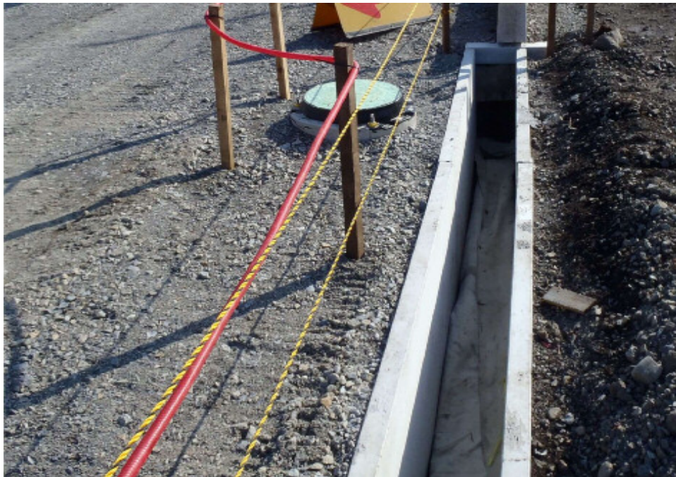
西都市 三宅無戸室