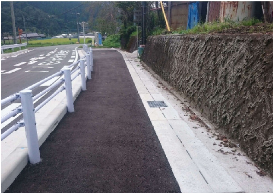
かんたん側溝<FS・BLタイプ>500