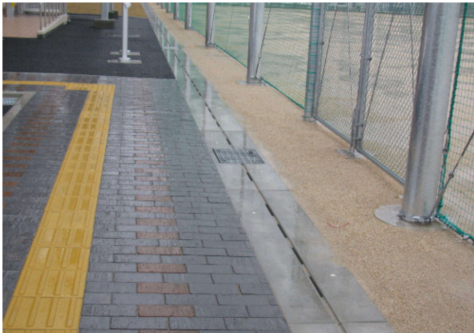
かんたん側溝 F S 300×300~800