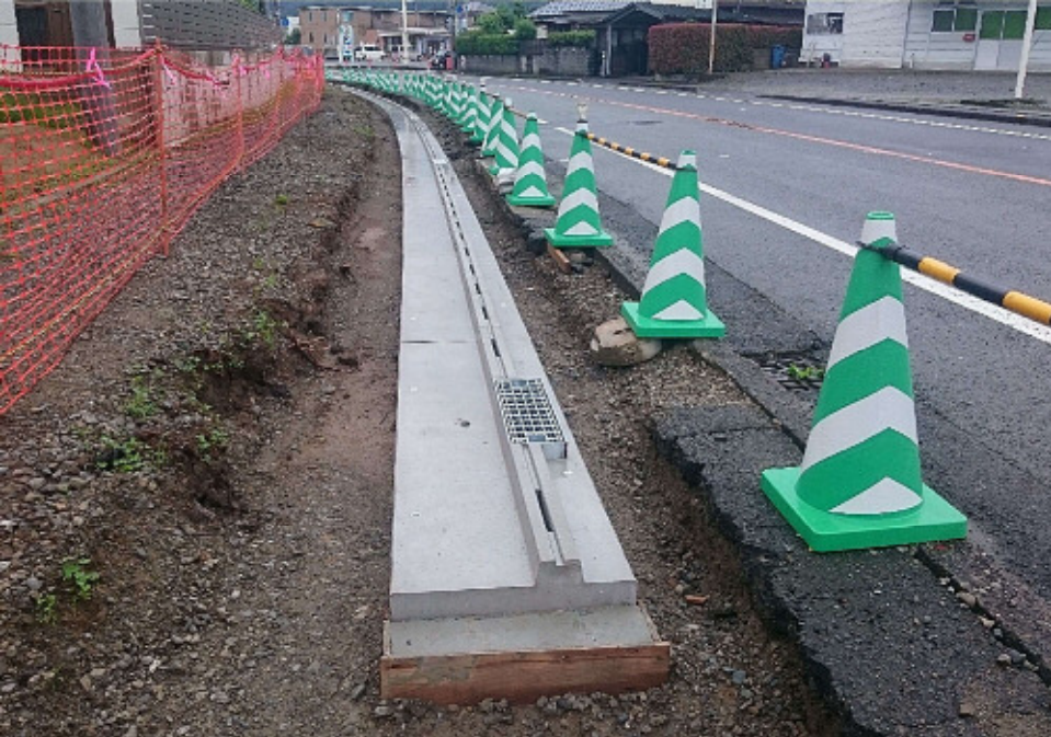
宮崎市高岡町 高鍋高岡線