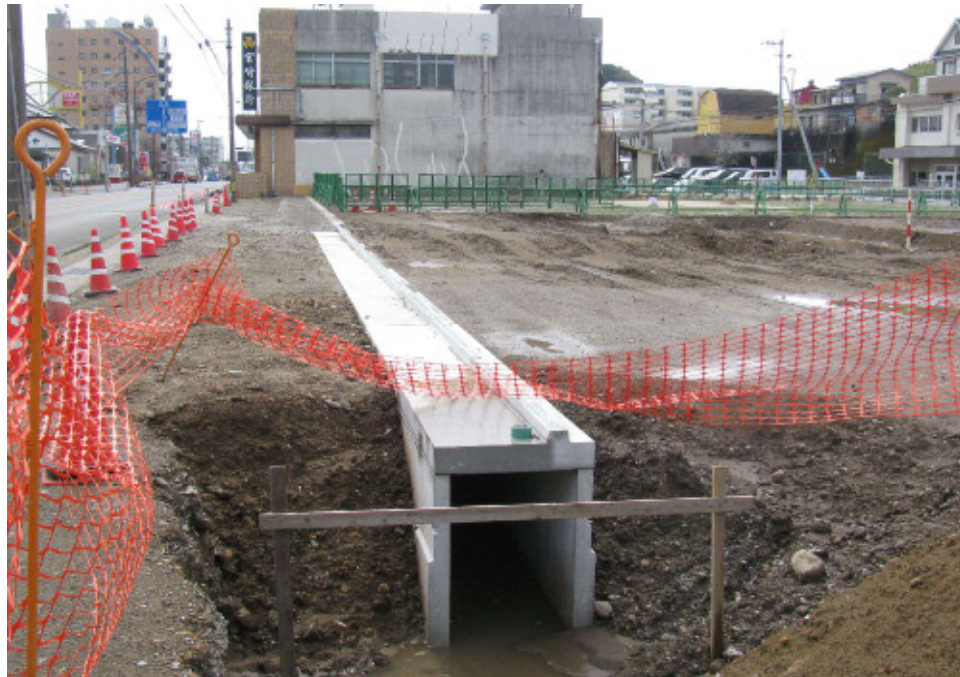
かんたん側溝<BLタイプ>600×1000