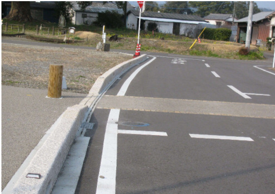
西都市 三宅無戸室