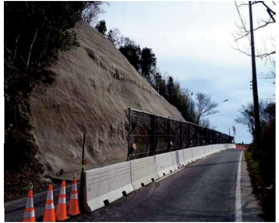
施工後:二車線道路の中央部に設置