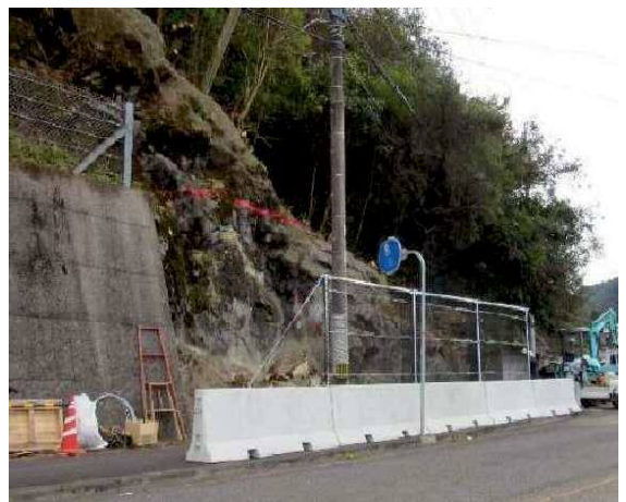
施工後：歩道端に設置