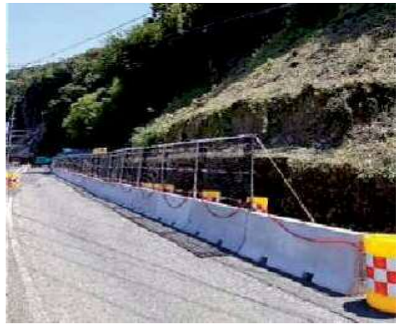
施工後：路肩に設置