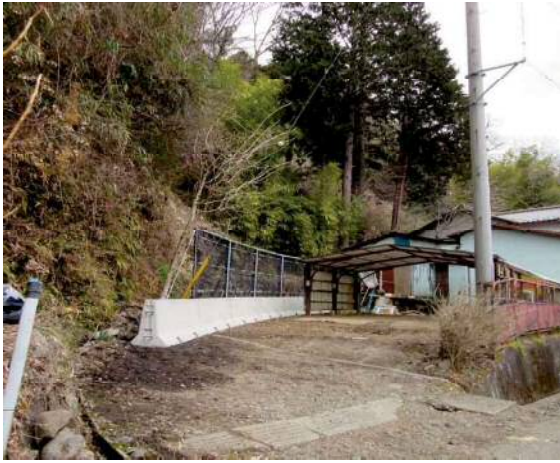
施工後:急傾斜地の民地への設置