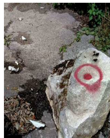
施工後3（基礎に衝突した落石）