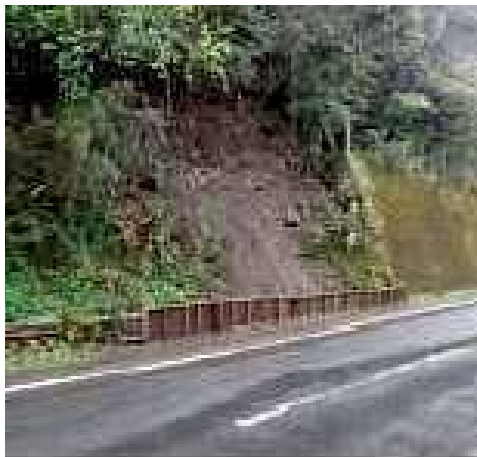
施工前（仮設に木柵）