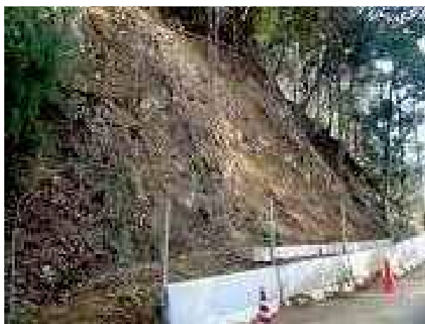
施工後（斜面崩壊が発生、土砂を受け止めた）