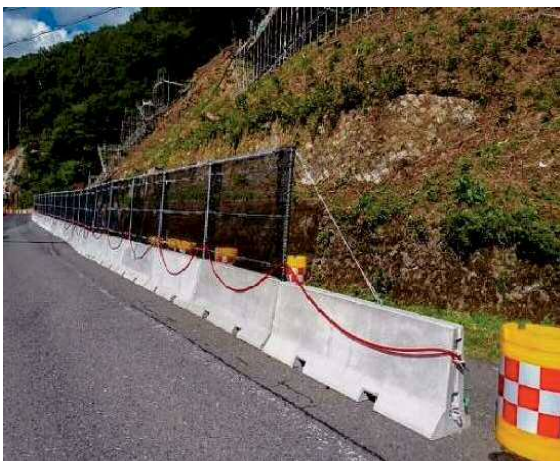
施工後：路肩に設置