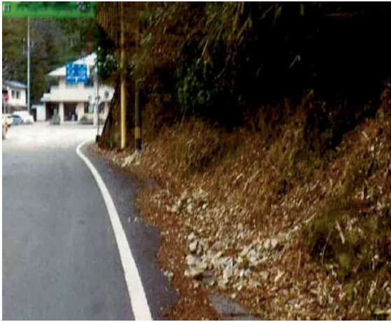
施工前（路肩の小石が落ちている）