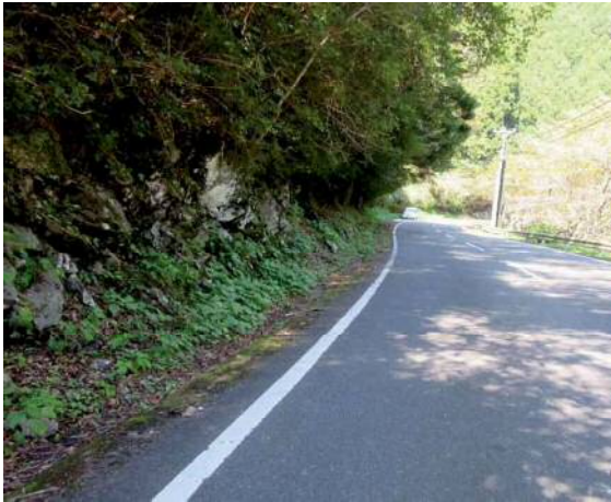
施工前（路肩に小石が落ちている）