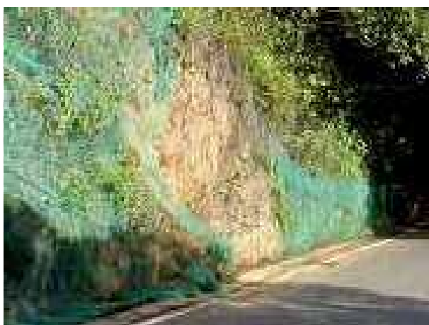
施工前（現状の斜面崩壊：網が裂けている）