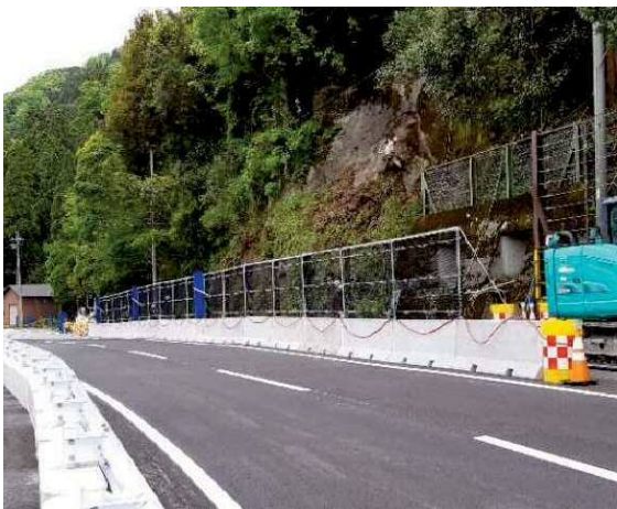
施工後：路肩に設置