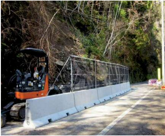
施工後：斜面側に重機が入って作業