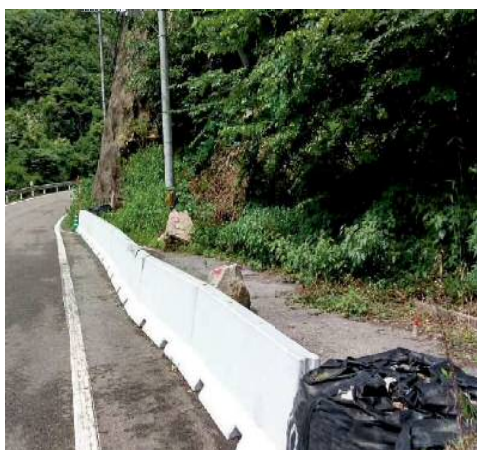
施工後1（1m程度の落石が基礎に衝突）