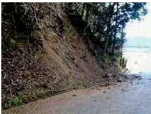
施工前（豪雨により斜面崩壊）