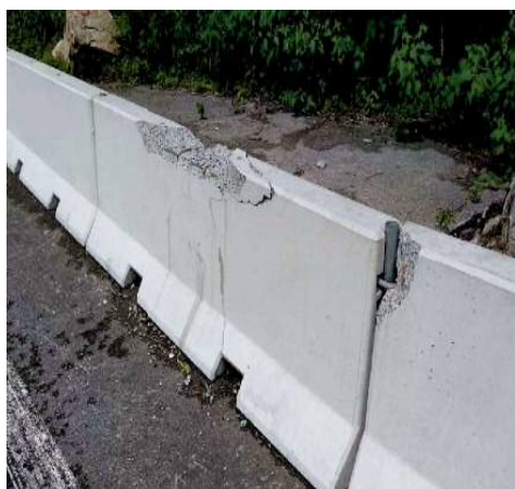
施工後2（上部、連結部が剥離した基礎）