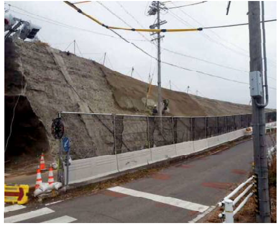
施工後：中央分離帯の内側に設置