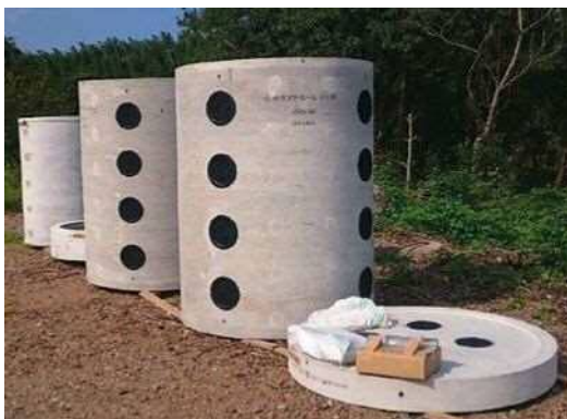
浸透型マンホール(2号AH φ1200 H4.5m)