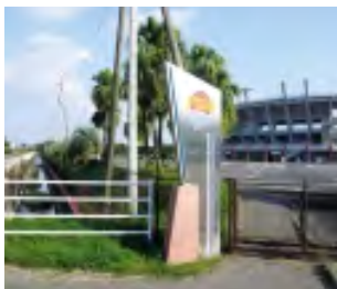
宮崎市木花 サンマリスタジアム